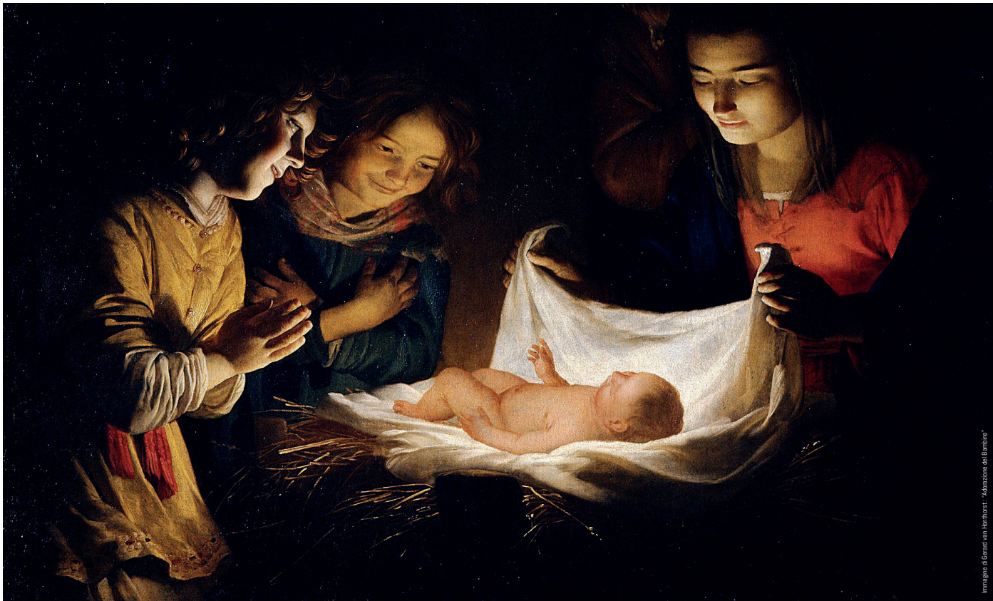
Immagine di Gerrit van Honthorst - "Adorazione del Bambino"