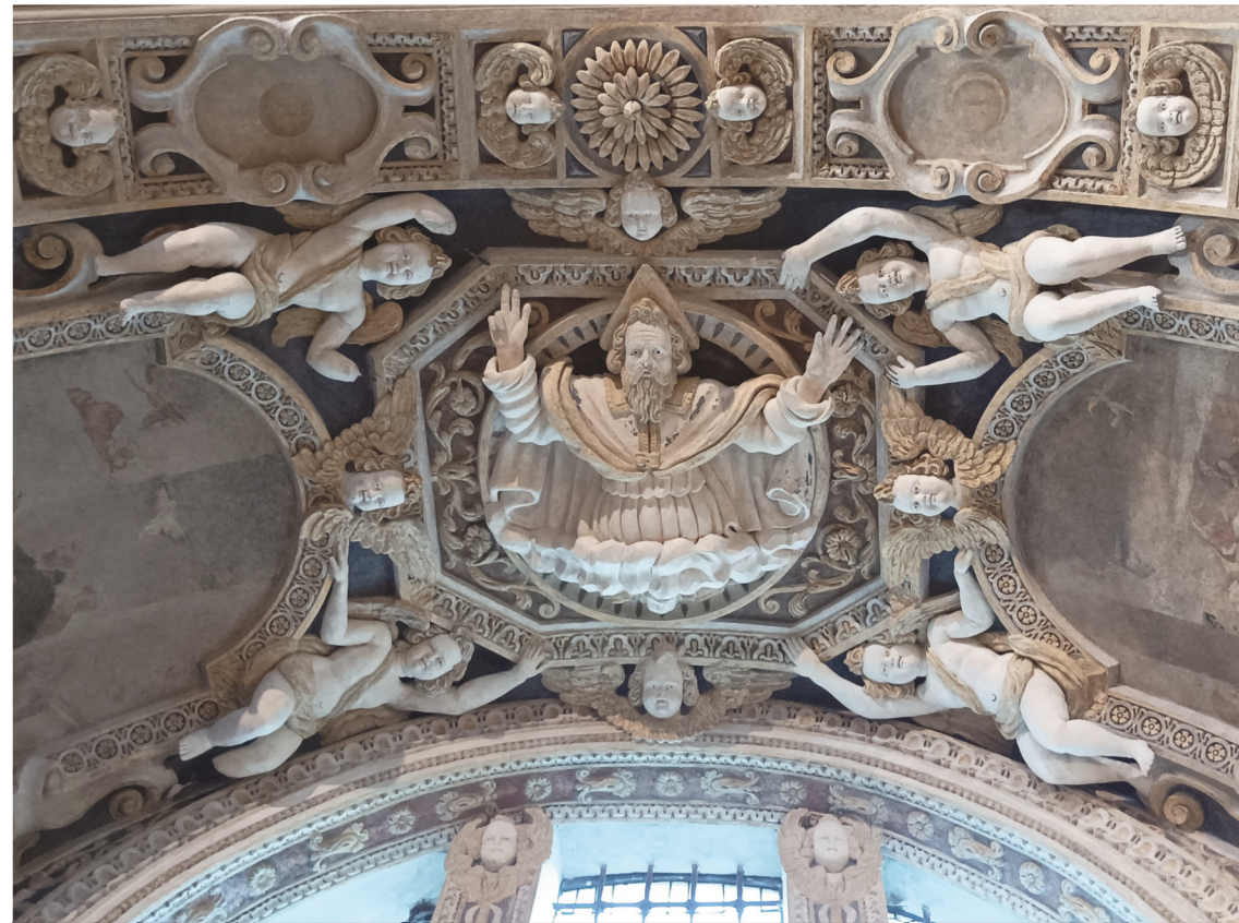
Immagine: Decorì a stucco della cappella della Madonna del Rosario, Chiesa di S. Maurizio - Ghiffa, XVII secolo. Grafica: Aligraphis